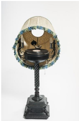
06_Lampen-Plattenspieler Objektinfo Booklet Einzigartigkeit in Serie Nr. 17

Stehlampe mit eingebautem Schallplattenspieler, um 1925