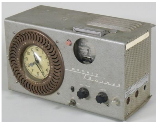
12_Dormiphone Objektinfo Booklet Technik, die begeistert? Nr. 2