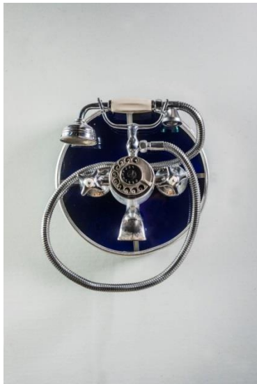
01_Duschkopftelefon Objektinfo Booklet: Marke Eigenbau, Nr. 4

Die Verwendung der Bilder ist im Zusammenhang mit der Berichterstattung über die Ausstellung kostenfrei. Bitte senden Sie uns einen Beleg oder einen Link.