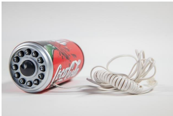
14_Cola- Telefon Objektinfo Booklet Einzigartigkeit in Serie, Nr. 8