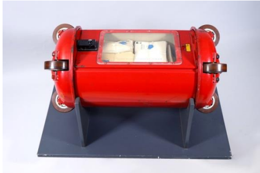
13_Großrohrpost Objektinfo Booklet Unterwegs, Nr. 1

Transportbüchse mit Musterbriefen der Großrohrpost Hamburg, 1962 Ingenieurbüro Herrmann Doss