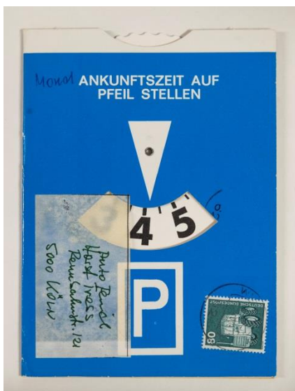
07_Parkscheiben-Brief Objektinfo Booklet Es geht auch anders Nr. 13

Parkscheibe als Mail Art-Postkarte, 1980er Jahre Michael Berger Museumsstiftung Post und Telekommunikation